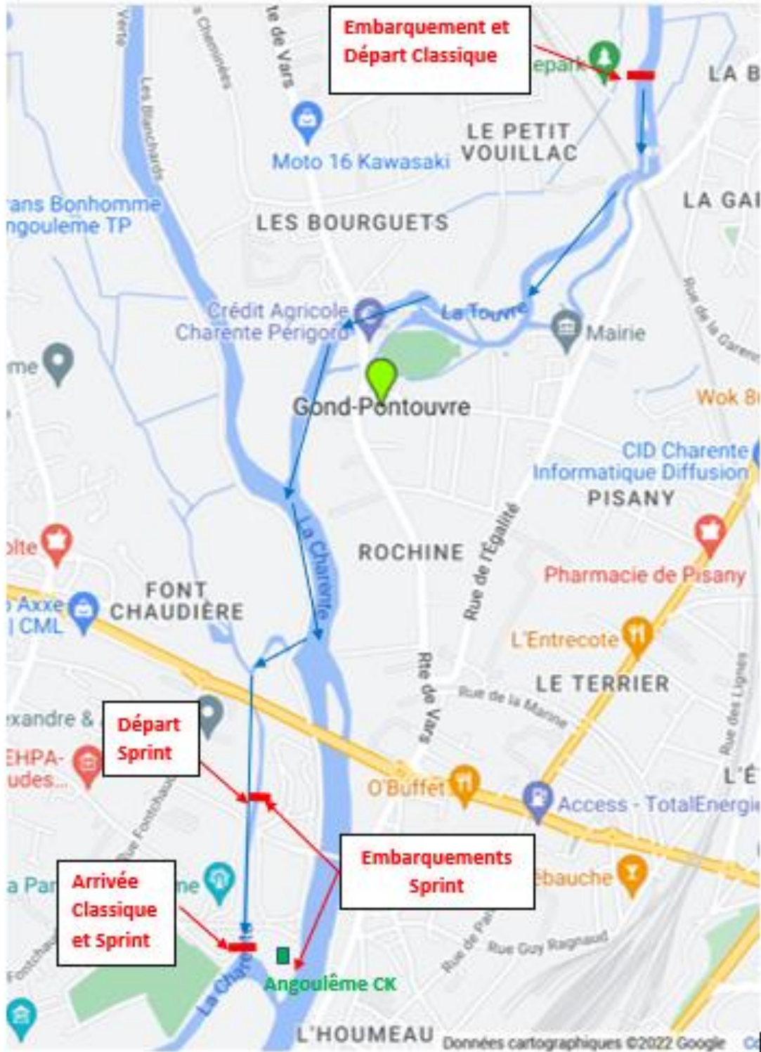
Plan des parcours